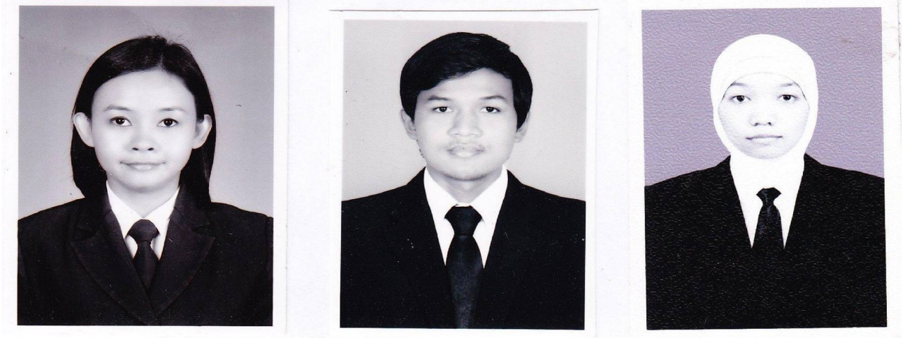
Contoh foto berkerudung